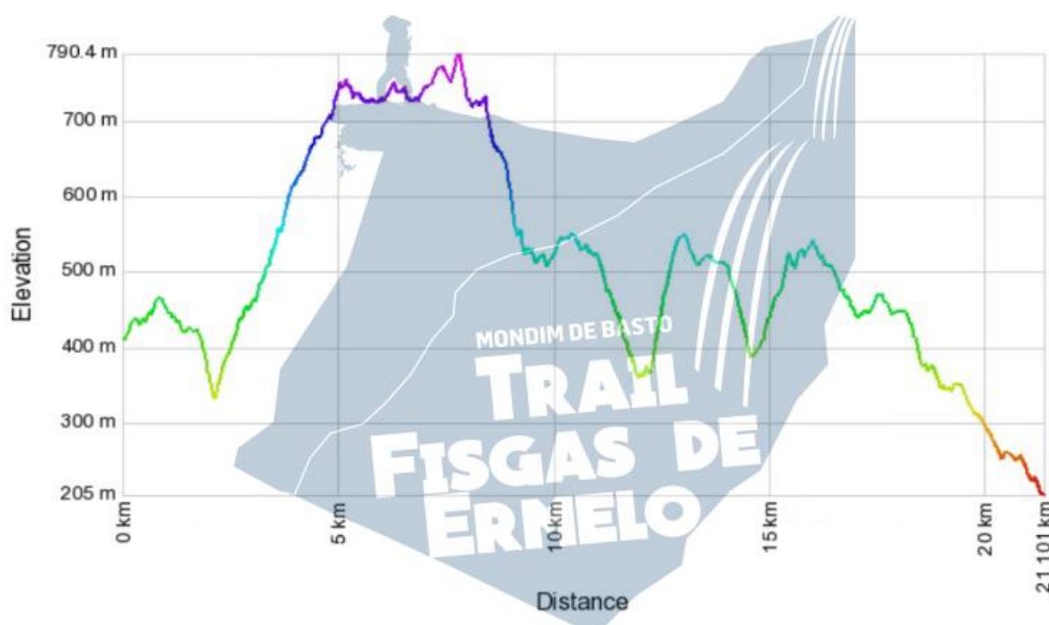
Gráfico do percurso